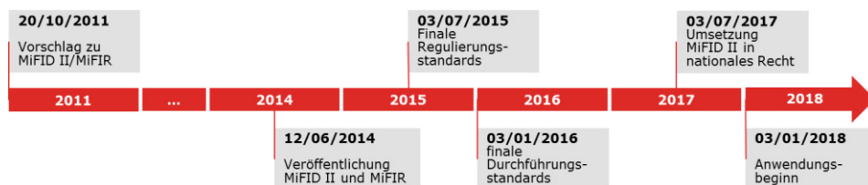
Abbildung 1: Zeitplan MiFID II / MiFIR